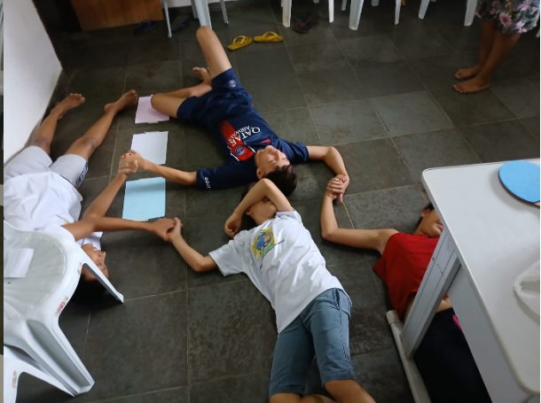
Grupo 2: Usuários Adolescentes – 11 a 15 anos